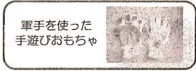
軍手を使った手遊びおもちゃ

軍手の片面にはキャベツと青虫を、もう片面にはきれいなちょうちょをフェルトで作った♪キャベツの中から♪の手遊びうたに合わせて楽しめる「軍手を使った手遊びおもちゃ」と、割り箸と洗濯ばさみだけでトングができて「身近にあるもので簡単おもちゃ」を作り、子どもたちとの楽しい遊び方までを実習しました。