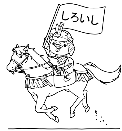
みやぎハローワークキャラクター 「ガンちょーさん」