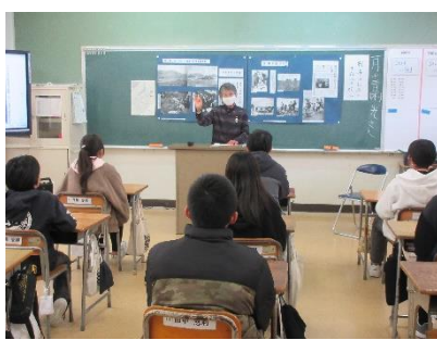
【 戦争体験講話 】