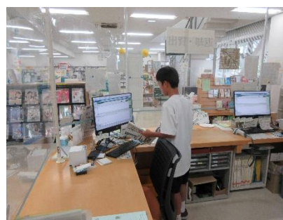
【 職場体験学習 】