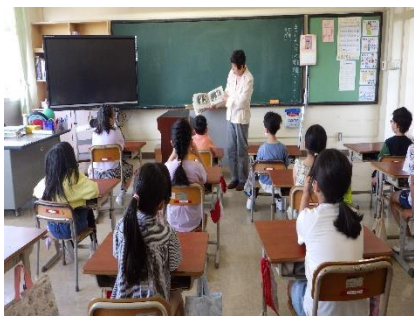
【 読み聞かせ 】