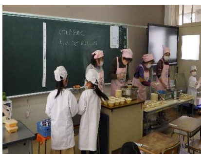
【 給食指導補助 】