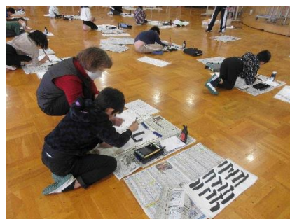
【 毛筆指導補助 】