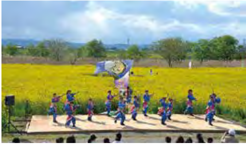
蔵王を遠望しながら開催する菜の花まつり

さらに、すぐそばを流れる阿武隈川は、豊かな自然と広大な河川敷を有し、その河畔からは蔵王を遠望することのできる優れた眺望ポイントとして多くの市民に愛され、ゴルフ場・パークゴルフ場に加