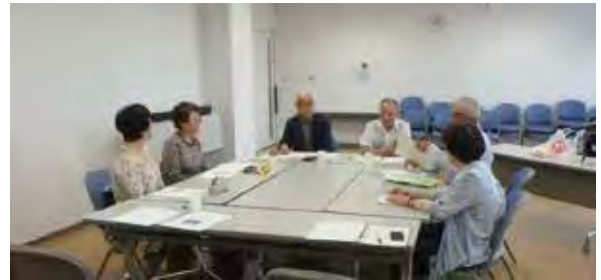
毎月の会長会議の様子

「民生委員・児童委員は、地域の身近な相談相手です。私たちには守秘義務がありますので、何かご相談ごとがあれば安心してご連絡ください。」