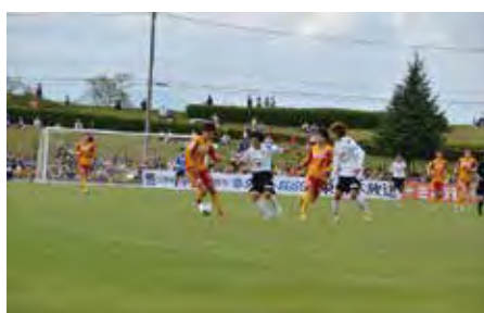
▲観るスポーツ：陸上競技場で、ベガルタ仙台レディースの公式戦が開催され、多数の市民が集う。