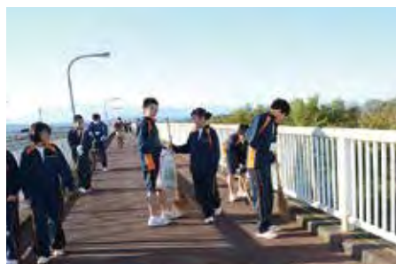
▲支えるスポーツ：阿武隈リバーサイドマラソンに備えての北角中生が清掃ボランティア。

総合戦略では目標の一つとして「地域資源を活かした移住・定住の促進」を掲げ、「交流人口の拡大」と「観光振興」などをキーワードにまちづくりを進めています。今回はスポーツ交流についての取り組みを紹介します。