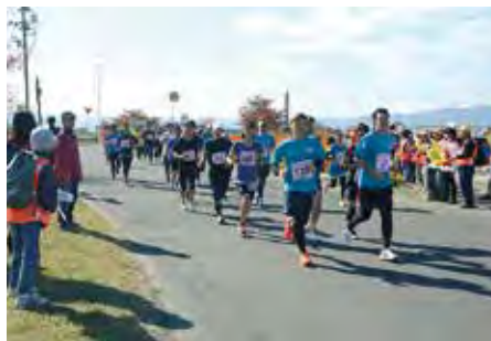
市内外から多数参加する阿武隈リバーサイドマラソン

え、毎年、菜の花まつりや阿武隈リバーサイドマラソン大会などの本市を代表するイベントの場となっています。