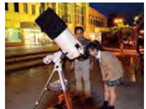
▲角田駅前での星空観察会