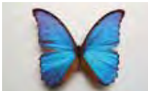
▲ダイタウスモルフォ