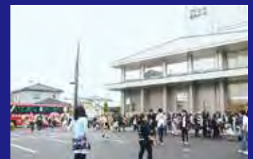
開場前の田園ホール。ライブに期待が高まる。