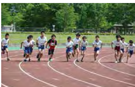
▲するスポーツ：陸上競技場で、こどもリレーカーニバルが開催され、多数の小学生が健脚を競う。

※スポーツツーリズム スポーツ観戦と周辺観光とを融合させ交流人口の拡大や地域活性化を図る取り組み