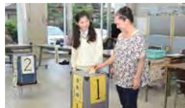
▲期日前投票に来た18歳の高校生

公職選挙法の改正により、70年ぶりに選挙権年齢が引き下げられ、 満18歳以上 から投票できるようになりました。将来を担う若い世代の声をこれまで以上に政治に取り入れるためです。