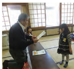
▲修了証書を手渡し