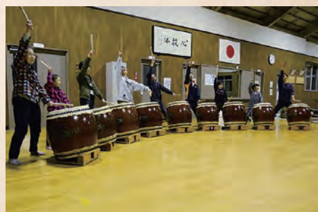
▲練習の様子。迫力ある太鼓の音が武道館に響きます。