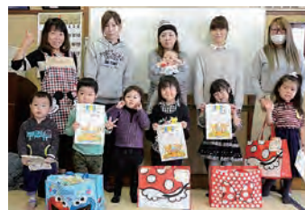
▲ちびっこ広場の皆さんと