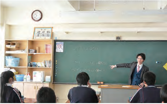
▲中学校での授業風景

市の人口は、今後益々減少、少子高齢化が進むものと考えられます（グラフ1参照）。市教育委員会が策定した「角田市学校施設整備将来構想」における児童生徒数の将来推計と、既に出生しているお子様が就学年齢に達する平成35年度の比較では、今後急激に児童生徒数の減少が起こることがわかります（グラフ2参照）。そこで今後の教育施設環境の将来と、児童生徒の学力・生活習慣の課題を市民の皆さまと考えていくきっかけとして、昨年10月に全国学力・学習状況調査の結果を公表いたしました。今回はその概要をお知らせいたします。 【問い合わせ】教育総務課（☎63-0130）