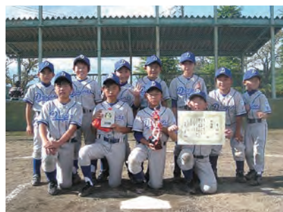
▲読売新聞社杯準優勝(9月30日)