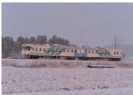
「雪の朝」 自由人さん