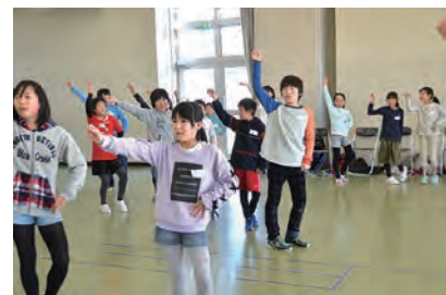
▲ダンスレッスン。キレキレの動きです。