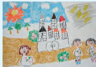
『びじゅとやじゆうを やったよ』