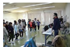
▲演技指導。みんな真剣です。

25年目の活動となる今年度は牟宇姫が題材になります。市内から5人の子どもたちが出演します。