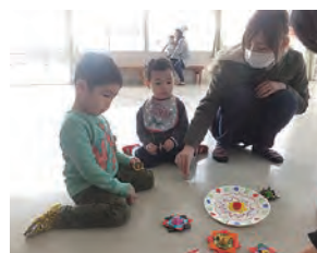
▲手作りこまでお正月遊び