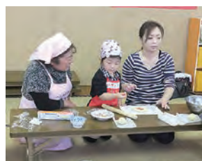
▲食改さんと手作りおやつ

最終回には、センター長から一人ひとりに修了証書を手渡されました。4月からは元気いっぱい児童センターや幼稚園に通ってくださいね。