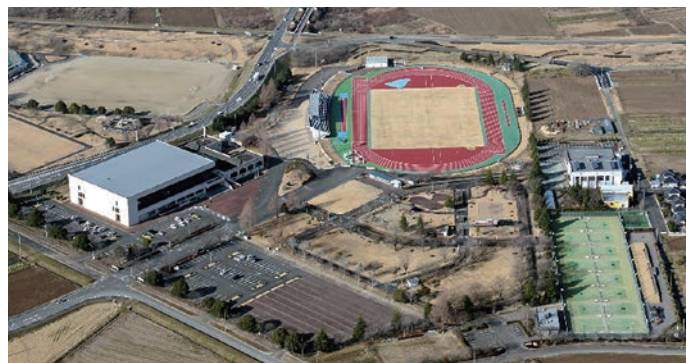
▲施設の使用料等が変更されます（写真はKスポ）

は、消費税率10%への改定時期と併せて、令和元年10月1日から改定することとしました。なお、消費税率の改定等以外で、施設使用料の全般的見直しを行うのは、平成16年に改定して以来となります。皆さまのご理解とご協力をよろしく願います。