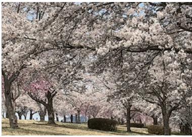
▲満開の角田の桜づつみ。右手にKスポ、左手に阿武隈川と残雪の蔵王連峰を眺める。(4/13撮影)

この「桜づつみ」が整備されてから26年、ようやく見ごたえのある桜並木に成長しました。来年あたりから、スポーツをしながら花見を楽しむ「Kスポさくら祭り」などを仕掛けてみて、もよいかもしれませんね。そしていよいよ、交流人口100万人を目指す賑わいの拠点施設として「道の駅かくだ」がKスポに隣接して4月19日にオープンし、地域物産等の販売と飲食サービスを開始しました。Kスポをはじめ河川敷にあるゴルフ場やパークゴルフ場などを含め年間30万人近い利用がある一大スポーツゾーンのサービス施設として、また、仙南観光の東のゲートウェイ（玄関口）として多くの利用が期待されます。これを機に、道の駅を拠点にした阿武隈川サイクリングコースや四方山トレッキングコースなどを新たに設定し、角田市だからこそできる「スポーツによる活力のあるまちづくり」を進めていきたいと考えています。がどうでしょうか。