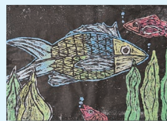
「世界に1匹だけのきれいな魚」