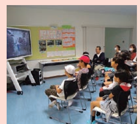
▲給食センターの施設を見学できます