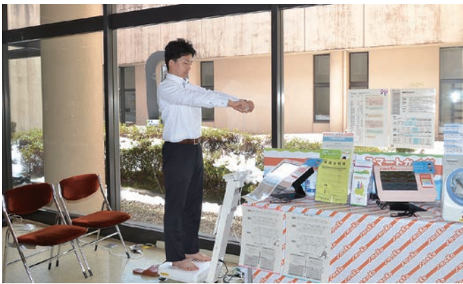
▲総合体育館内の測定機