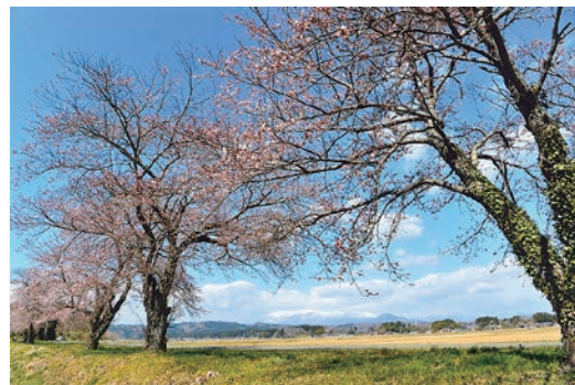
「開花宣言」 自由人さん