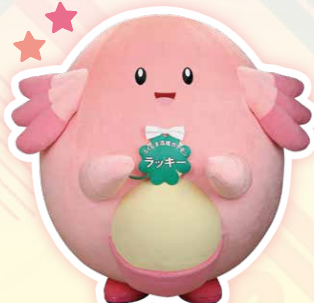
ふくしま応援ポケモン「ラッキー」