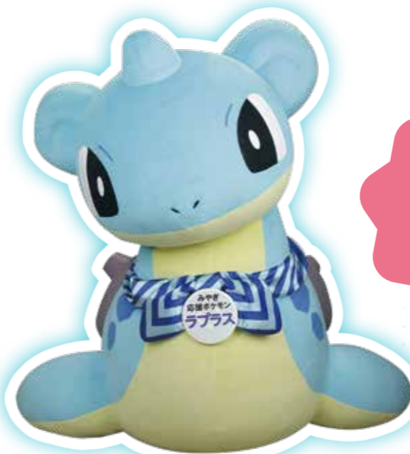
みやぎ応援ポケモン「ラプラス」