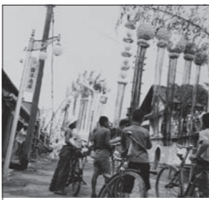
本町の七夕祭り(昭和30年頃)