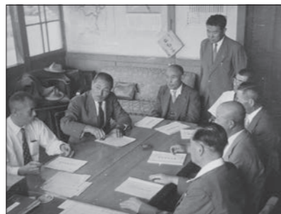
合併調印式の様子(昭和29年)

明治22年、「町村制」施行に伴い初代角田町が誕生しました。昭和29年、角田町と枝野村・北郷村・桜村・西根村・東根村・藤尾村の7町村が合併し新生角田町へ。その後、市制施行により昭和33年10月1日に角田市となり、現在に至ります。