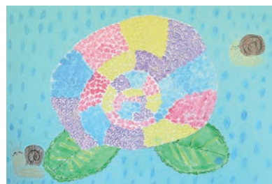
カラフルあじさい