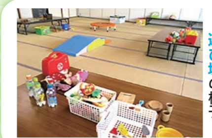
市民センター和室 遊び場の様子

日時 7月26日(水) 10:00～10:50 対象 2～3歳児と保護者 場所 市民センター