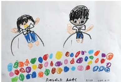
たのしかった えんそく