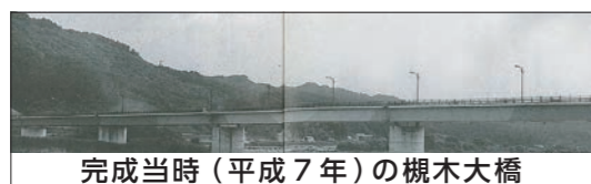
完成当時(平成7年)の槻木大橋