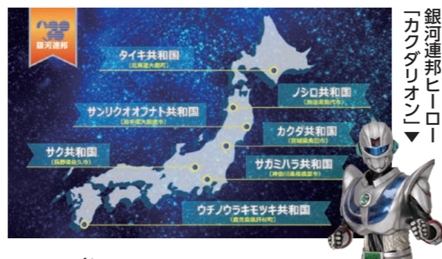
銀河連邦ヒーロー「カクダリオン」

銀河連邦とは、宇宙航空研究開発機構(JAXA)の研究施設がおかれている自治体で構成された組織です。角田宇宙センターがある宇宙のまち角田も「カクダ共和国」として平成28年に加盟。令和元年東日本台風で角田市が被災した際には職員の派遣や支援金をいただくなど、加盟国同士が密に連携しています。