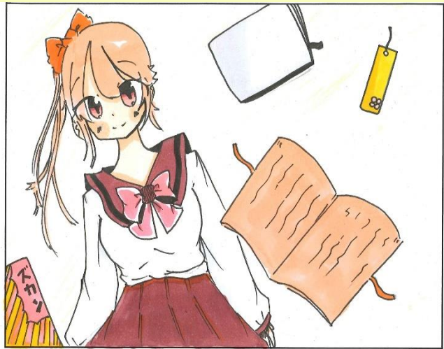
北角田中学校 ペンネーム「だいず。」さん