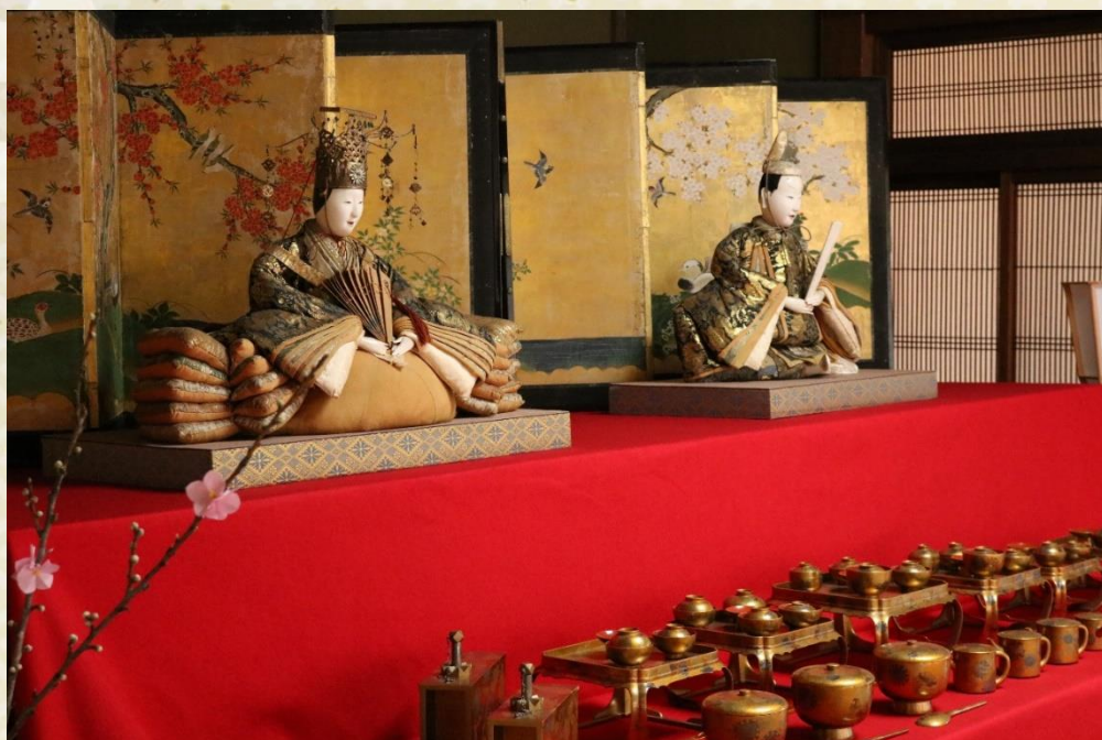
伊達家ゆかりの雛人形と雛道具(江戸時代)

高さ 45 cm の雛人形と伊達家の家紋「雪 薄 紋」入りの金梨地蒔絵が施された豪華な雛道具は、仙台藩主伊達家の息女が角田館主石川家に嫁いだ際、持参されたものと伝えられています。