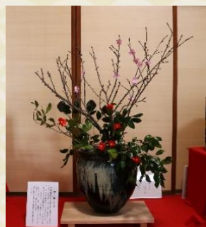
石川家の雛まつりに飾られた ふきばな 吹花を再現