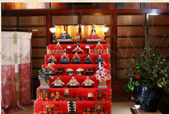
七段飾り(昭和 50 年代)