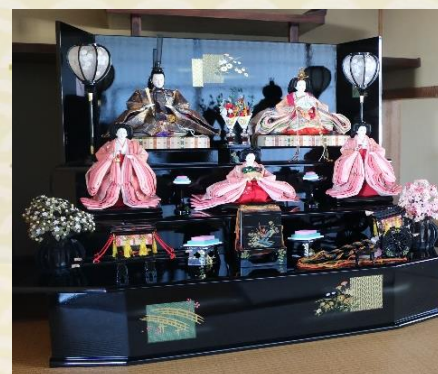
三段飾り(平成初期)