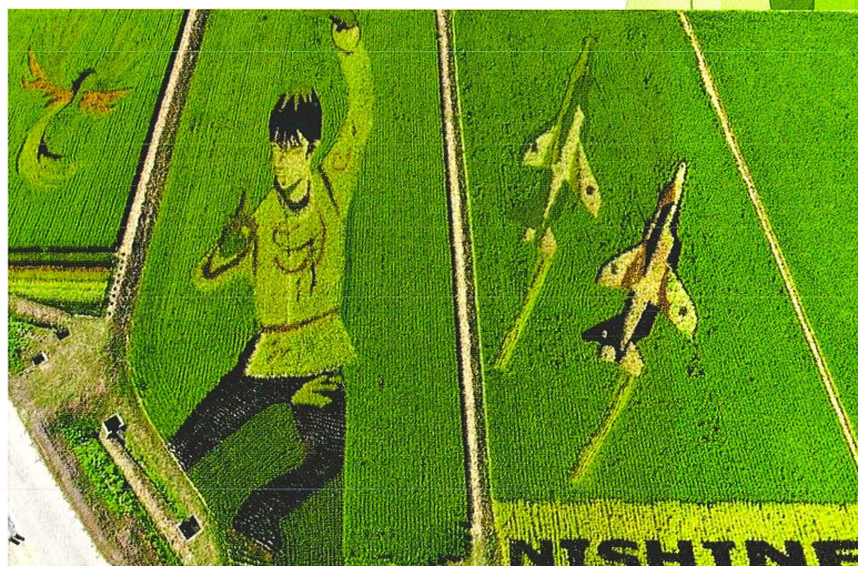
2021年 羽生結弦選手と不死鳥、ブルーインパルス