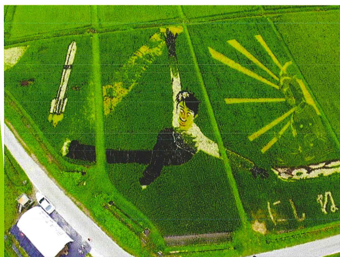
2019年 羽生結弦選手と阿弥陀如来坐像、 HⅡロケット