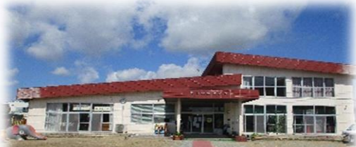
子育て支援センターまめっこ