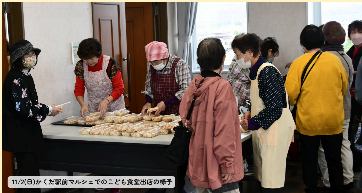
11/2(日)かくだ駅前マルシェでのこども食堂出店の様子

『角田(かくだ)+便り(たより)』と『Fromかくだ(角田より)』の2つの意味を組み合わせています。 角田市で活動する“ひと”や“市民活動団体”の今をお届けします。