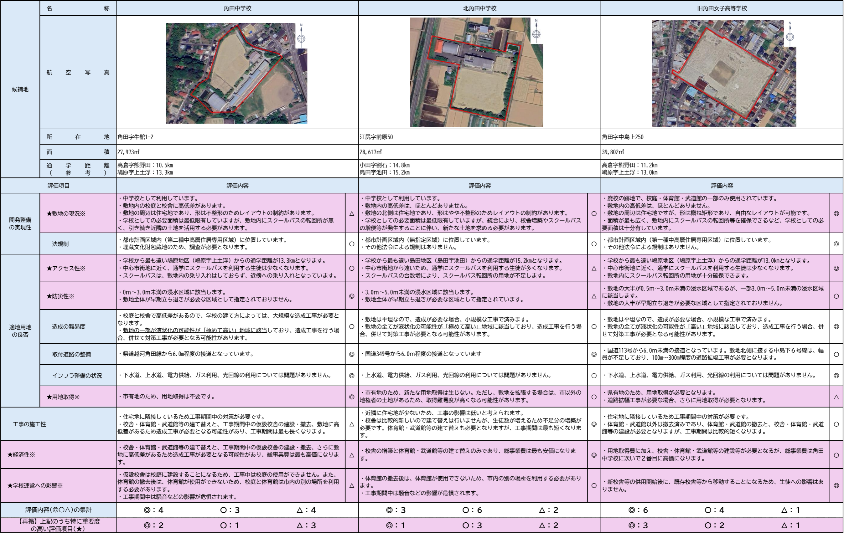
表2. 3候補地の比較検討

※ 評価項目のうち、特に重要度の高い項目（立地、防災性、経済性、学校運営への影響）については『★』をつけています。