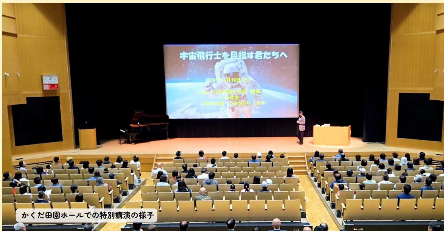
かくだ田園ホールでの特別講演の様子

『角田(かくだ)+便り(たより)』と『Fromかくだ(角田より)』の2つの意味を組み合わせています。 角田市で活動する“ひと”や“市民活動団体”の今をお届けします。