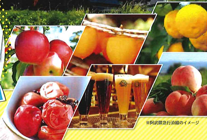
※阿武隈急行沿線のイメージ