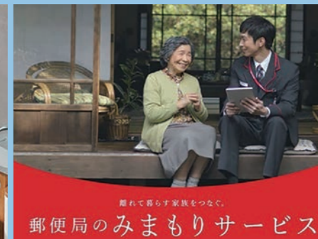
郵便局のみまもりサービス