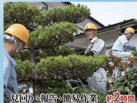
見回り・報告・簡易作業 約2時間

『ふるさと納税』は、「生まれ育ったふるさとや地域を大切にしたい」「ふるさとのために貢献したい」という思いを「寄附金」というカタチにするものです。