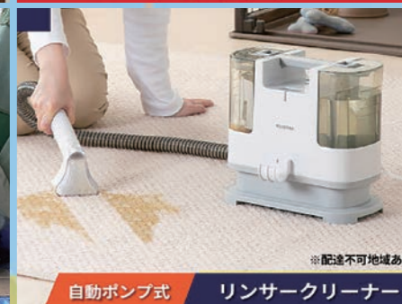
自動ポンプ式 リンサークリーナー