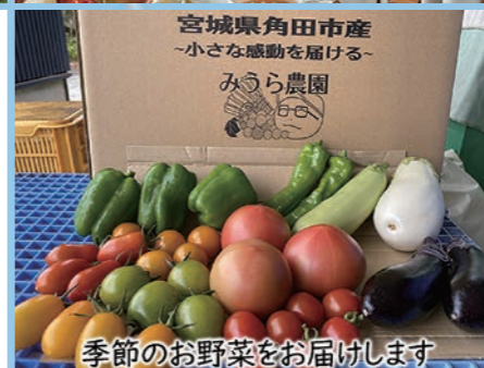
季節のお野菜をお届けします