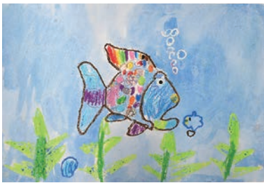
にじいろのさかなをよんで