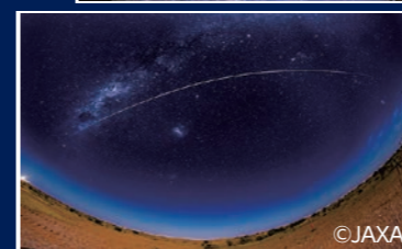
▲ カプセルの帰還、火球確認(写真上部の右から左に向かう線)

や有機物はケイ酸塩という鉱物に取り込まれた形で見つかりました。このケイ酸塩がゆりかごのような働きをして、熱や放射線などの厳しい宇宙環境から水や有機物を守ってくれていたようです。今後出てくる解析結果も合わせて、水や生命の起源が少しずつ解明されるとワクワクしますね。 はやぶさ2カプセルの特別展(10月1～2日/JAXA角田宇宙センター)では、32億キロメートルの旅を経て、地球まで帰ってきたカプセルとリュウグウの砂が展示されます。そしてはやぶさ2は今、次の新たな目標の小惑星に向けての旅を続けています。あと100億キロメートル、11年の長旅です。まだまだ元気なはやぶさ2のご様子、皆さんも応援をお願いします。(JAXA角田宇宙センター 吉田誠)