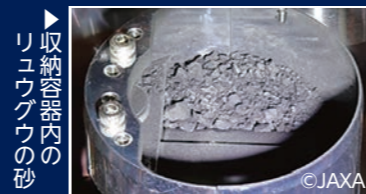
▶ 収納容器内のリュウグウの砂