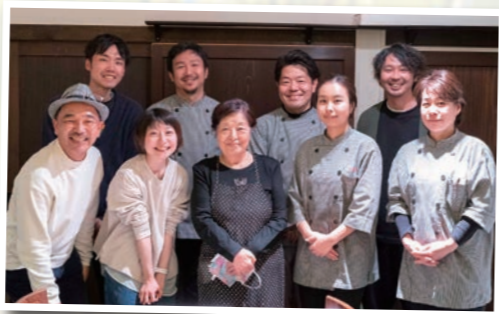
▲お客様とプロジェクトのワンシーン

新型コロナウイルスによって、ビジネスモデル変革が求められる時代となりました。その変化に対応していくため、既存の事業に加えて、コロナ禍で需要が高まったEC事業を令和3年に開始し、農業生産部門にも取り組んでいます。この2年間は、ゲストハウスをはじめとした観光事業は集客面で打撃を受けましたが、継続してユーザーに向けて発信をし続けることで、新規での利用客が増えてきています。今後も時代の変化を読み取りつつ、事業に関わる方々が幸せを共有できる仕組みづくりを目的とし、事業に取り組んでいきます。