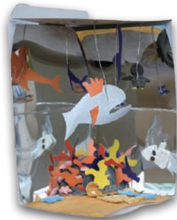
いろいろな種類の魚がいる水族館