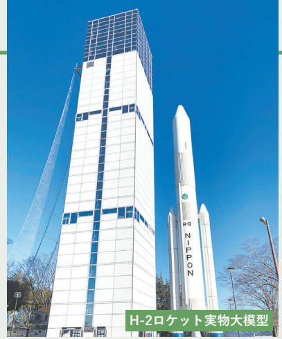
H-2ロケット実物大模型

仙南随一の穀倉地帯として知られ、豊かな田園風景が広がる角田市。大豆や梅、野菜、果物の生産も盛んで、製造業も多く立地しています。宇宙航空研究開発機構（JAXA）角田宇宙センターがあり、H-2ロケットの実物大模型やロケットエンジンに身近に触れることができるほか、広い平地を生かしたスポーツ施設も充実しています。