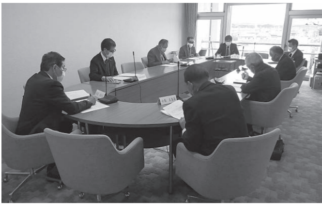
▲総務産業常任委員会

※総務産業常任委員会の報告を受け、市議会は、市に対し稲作経営農業者支援に係る提案(4ページ上段参照)と、国に対し意見書(2ページ中段参照)を提出しました。