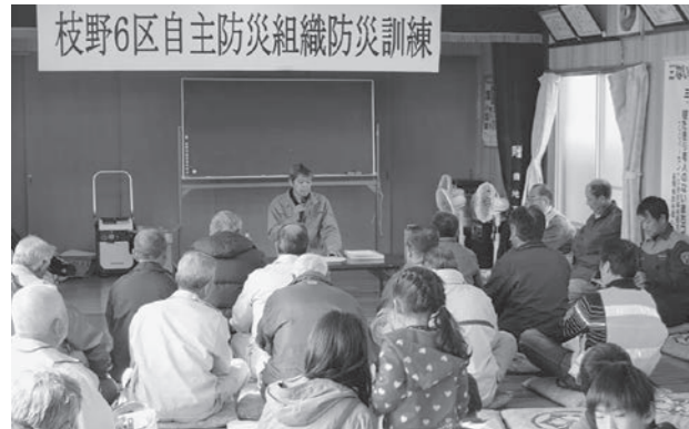
▲平成27年11月22日開催 枝野6区自主防災組織防災訓練『防災講話』の様子

災害の発生、または災害が発生するおそれがある場合で、住民を避難させる必要があると判断したときは、避難勧告等を発令します。また、法令により、特別警報(大雨・洪水)や土砂災害警戒情報、洪水予報についても、市は住民に防災情報(※1)をお知らせします。また、それらの情報は、角田市地域防災計画において、複数の伝達方法(※2)によって提供すること