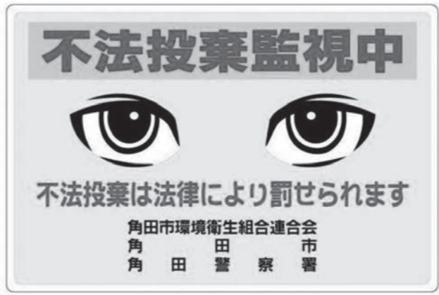
▲不法投棄防止看板(平成26年度 130枚設置)

「看板等の増設を含めた広報の周知徹底」、「仙南地域広域行政事務組合に対する負担金の減額分やダンボール等の売り払い収入等市民が努力した分は、ごみ分別や不法投棄対策として予算化」、「市独自の不法投棄者の摘発方法」、「罰則を含めた条例制定」の検討を要望します。