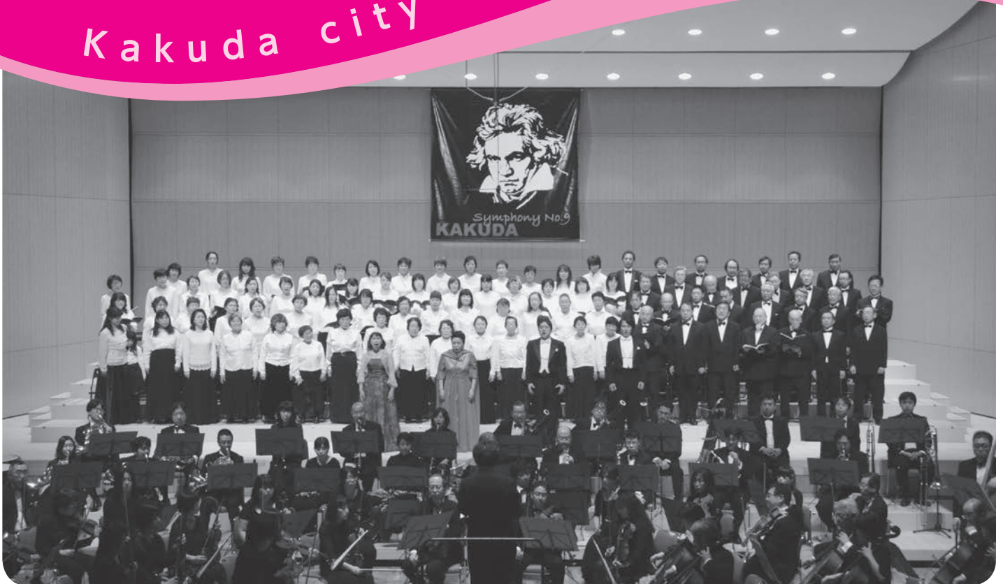
▲『角田ベートーヴェン第九公演』のようす（平成27年12月6日「かくだ田園ホール」にて）