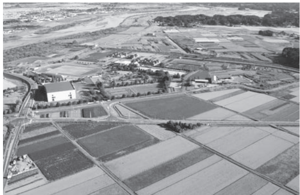
▲賑わいの交流拠点施設「道の駅」整備予定地

「③将来に向けての財政計画の見通しについて」は、平成26年度には、市民センター整備事業、平成27年度には給食センター整備事業と大規模事業を実施しています。そして、平成28年度以降は賑わいの交流拠点施設整備事業を予定しておりますが、その財源は国庫補助金、地方債のほか一般財源で約1億9,800万円となっております。平成26年度末の財政調整基金の残高は約19億円となっており、実施計画により平成28年度以降も各種事業実施による取崩しを予定していますが、大規模事業が終了する平成30年度末においても決算ベースにおいて基準値である標準財